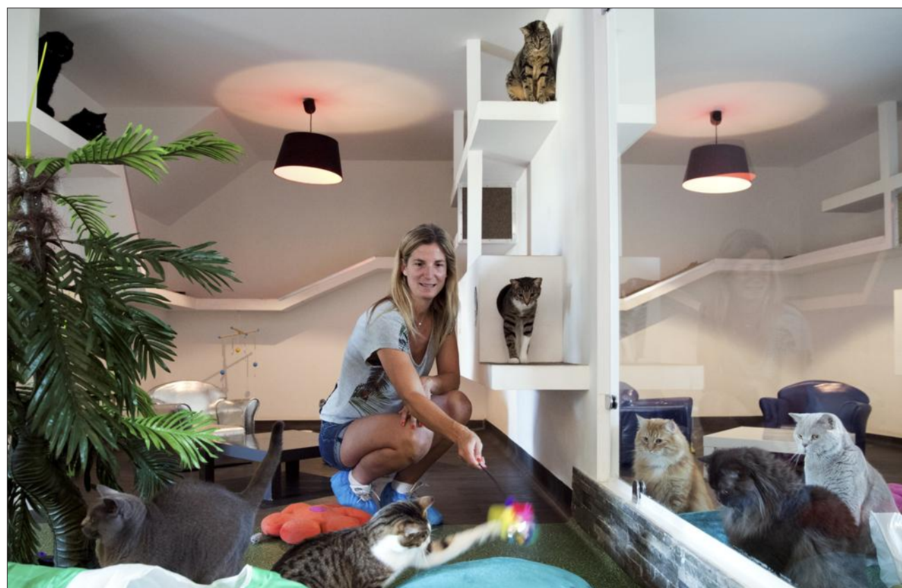
Une vraie colonie de vacances pour matous chez Les Pachas d'Amandine, un hôtel de luxe installé à Villaz.

« C'est que du bonheur de la retrouver. » Les sourires se lisent sur leurs visages bronzés par le soleil du Sud.